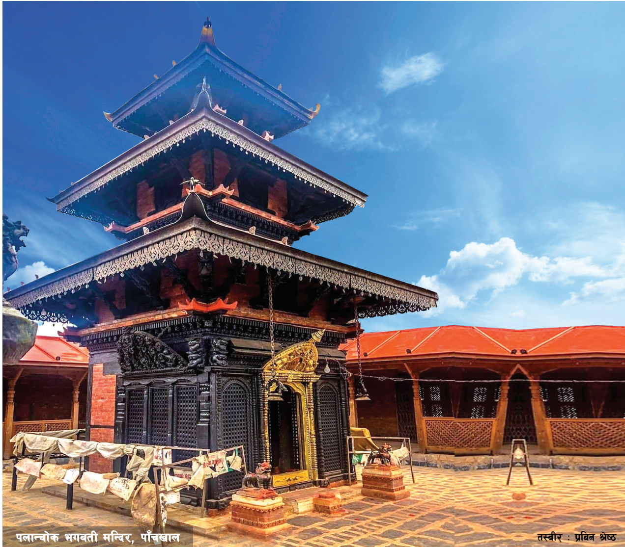
पलान्चोक भगवती मन्दिर, पाँचखाल