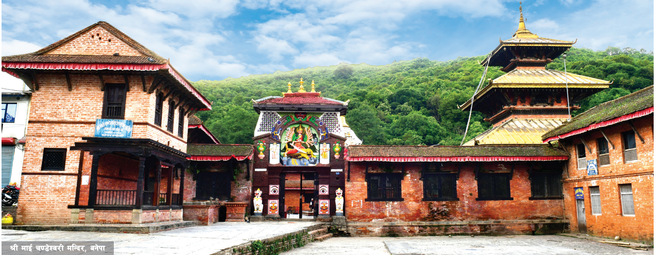
श्री माई चण्डेश्वरी मन्दिर, बनेपा