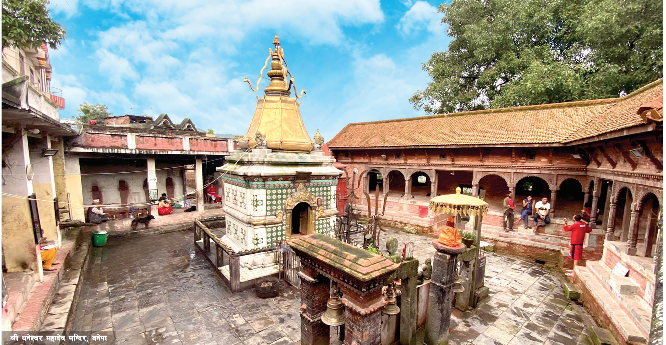
श्री धनेश्वर महादेव मन्दिर, बनेपा