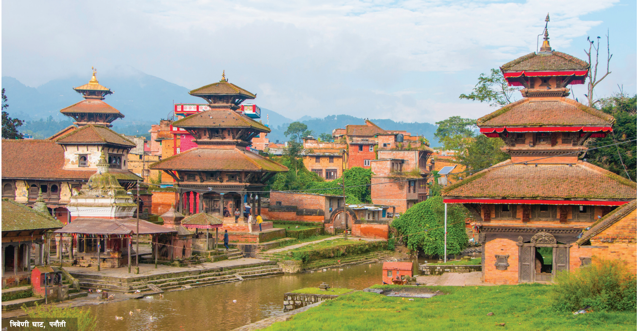
त्रिवेणी घाट, पनौती