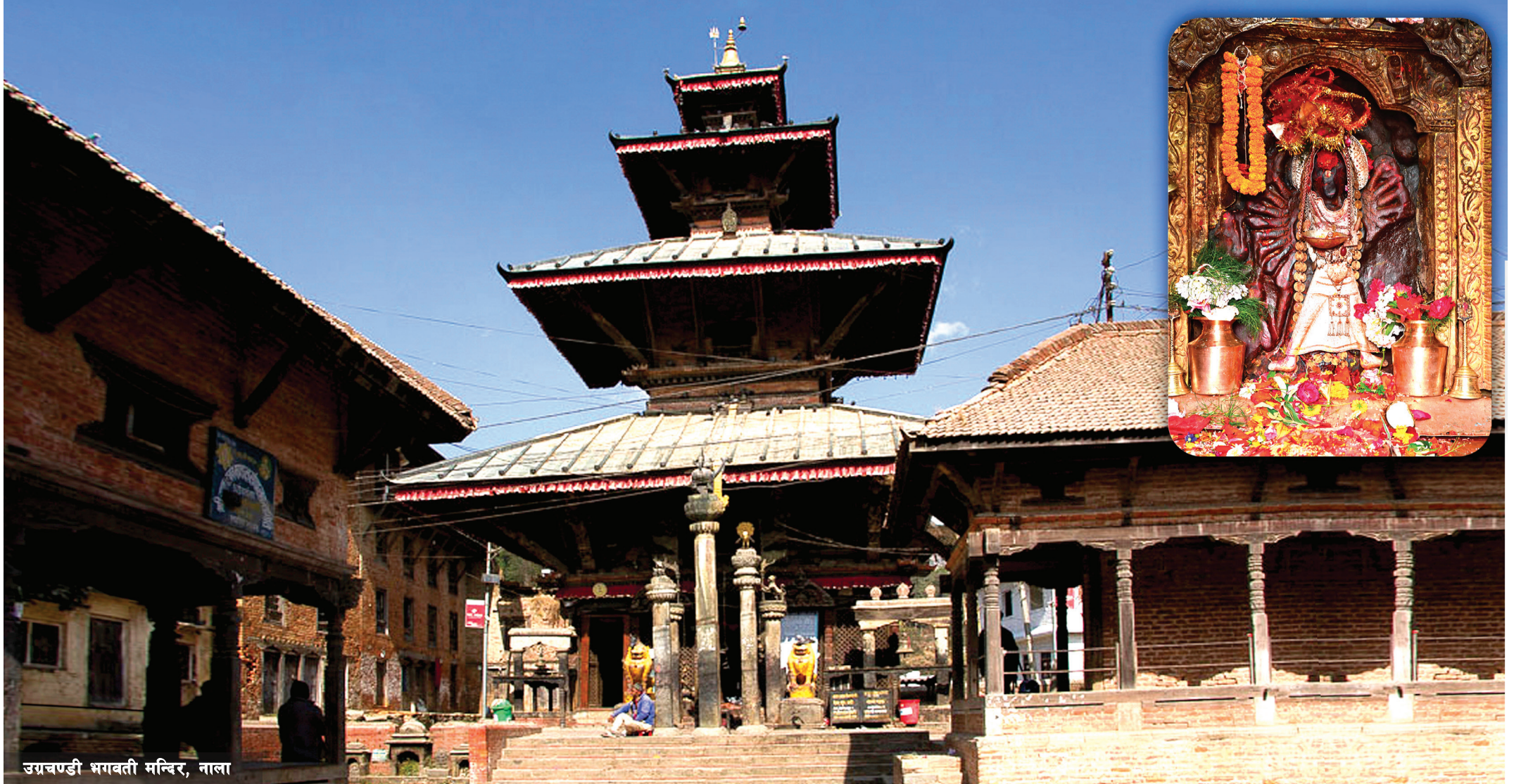
उग्रचण्डी भगवती मन्दिर, नाला